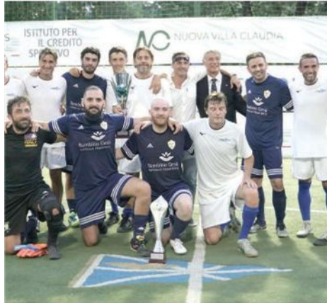
I protagonisti del Charity Match al CC Lazio

Fondazione Bambino Gesù Onlus. L'intero ricavato della cena di beneficenza che ha seguito la partita, verrà consegnato alla Fondazione Bambino Gesù nella cena di gala in programma domani sera al Circolo Canottieri Lazio.