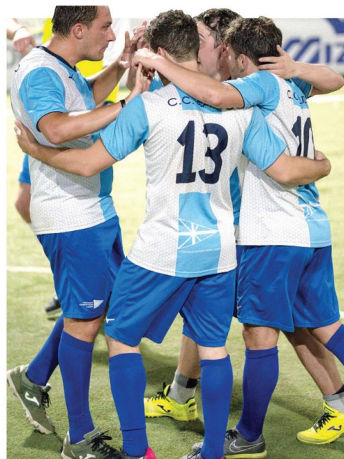
L'abbraccio dei giocatori del Circolo Canottieri Lazio, che non vincono il torneo dal 2015