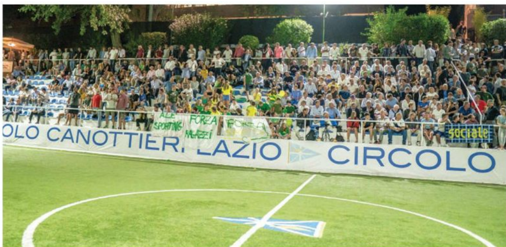
Anche stasera la Fossa del CC Lazio si annuncia tutta esaurita per il gran finale della Coppa Canottieri Zeus