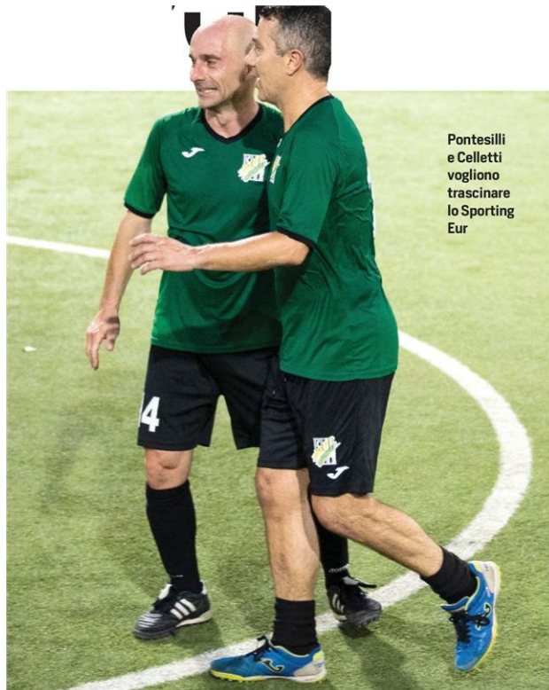
Pontesilli e Celletti vogliono trascinare lo Sporting Eur