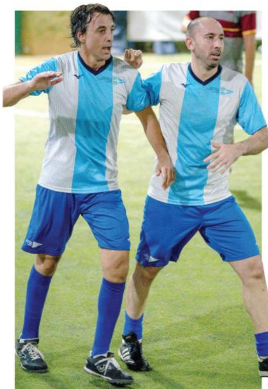
A destra Luca Ippoliti, campione d'Europa nel 2003